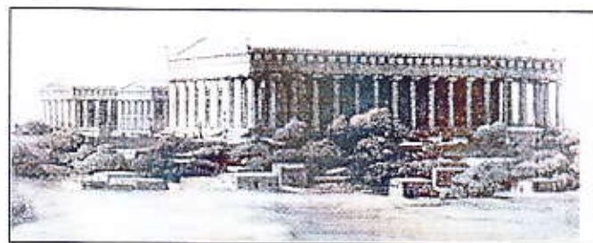
ricostruzione della collina orientale di Selinunte: a sinistra il Tempio "E", ricostruito negli anni '50

Né ha trovato fortuna l'appello lanciato quaranta anni or sono da Rosario Romeo, lo storico di Giarre rettore dell'Università Luiss, per la ricomposizione del tempio G di Selinunte. Nell'affermazione dell'identità dei siciliani, per il definitivo ingresso dell'Isola nel grande circuito turistico internazionale come antidoto al suo decentramento economico e culturale. E nemmeno l'intento emblematico di quella proposta appare raccolto da chi ha rilanciato in questi mesi lo stesso disegno. Si tratta del deposto presidente della Regione, di un critico dell'arte e noto polemista, e di un giornalista e storico di richiamo televisivo. Non