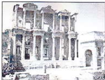
Biblioteca di Celso ad Efeso

Ma questo non basta, nemmeno per sogno. La ricostruzione della Biblioteca di Celso, ad Efeso, ha sbaragliato l'intera città sepolta di Pompei. Quel solo monumento ha richiamato in Anatolia milioni di visitatori nello scorso anno, con un incasso che vola