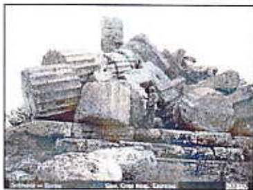
Rovine del Tempio "G"

Il tempio G di Selinunte è più che una speranza. Le sue colonne, con le architravi e gli immensi capitelli, sono rimaste sul terreno, abbattute dai cartaginesi e dalla natura, e da due secoli chiedono di essere risollevate. Quello che poteva